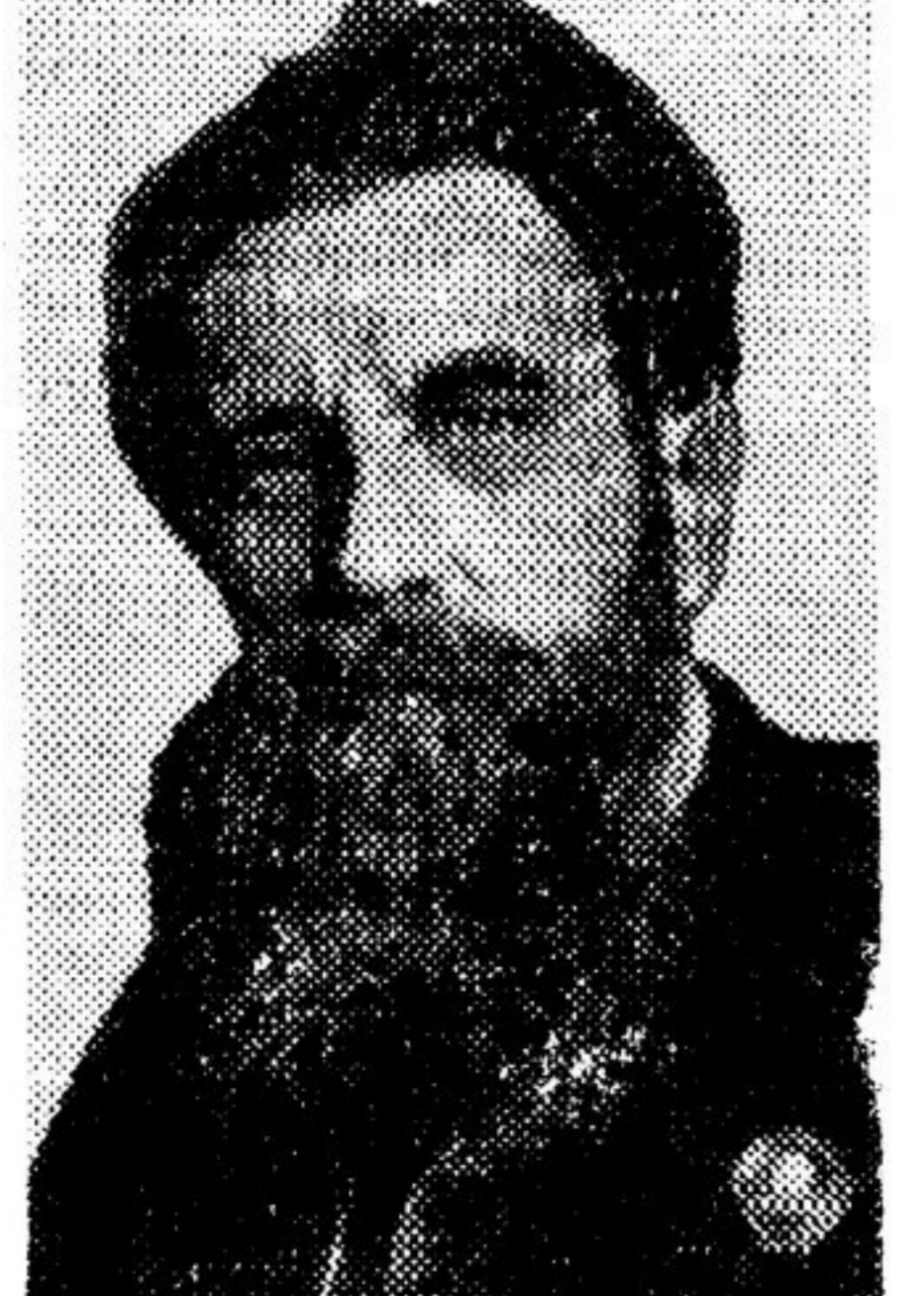
Проф. О. Ю. Шмидт

Смешка ученых с писателями, которая проводится Оргкомитетом, и в частности, беседа Отто Юльевича Шмидта с писателями оставила глубокий след: надо думать, многие писатели горят, как Отто Юльевич Шмидт, и постараются, когда он вернется невредимым, показать его в художественном произведении в пример молодым и растущим, с каждым днем уединивающейся преуспевающей армии героических советских ученых, летящих, плавающих и вечно работающих над укреплением культуры и мощи советской страны.