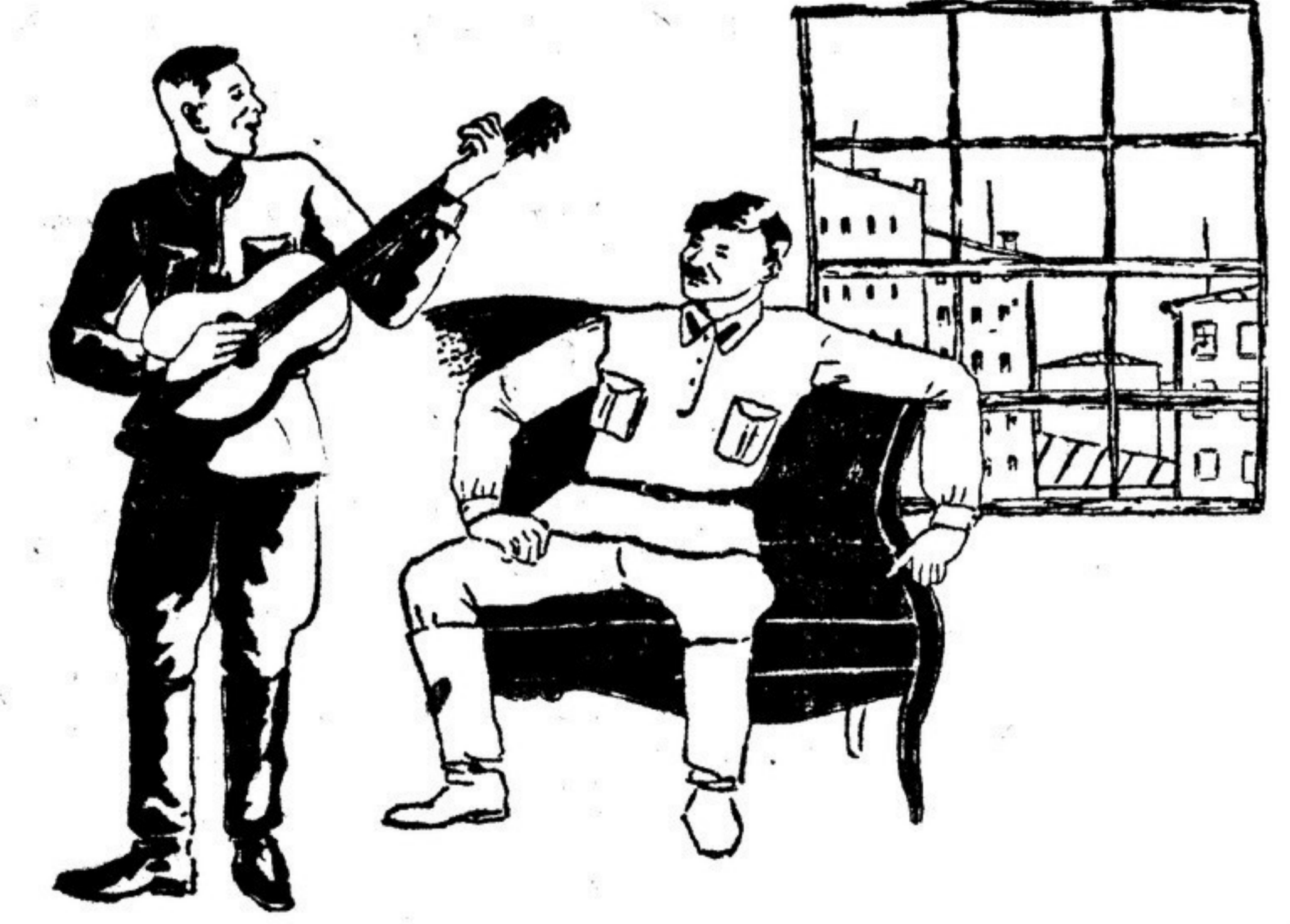
Рис. Н. Соколкин.