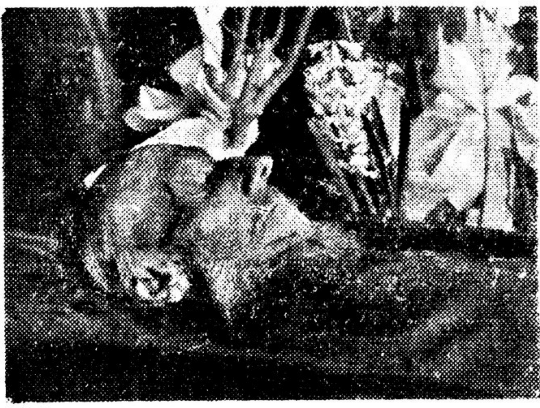
С. П. Под'ячев в гробу

На прошедшем митинге в крематории друзья и почитатели покойного снова возвратились к отдельным, наиболее характерным этапам этой интересной жизни.